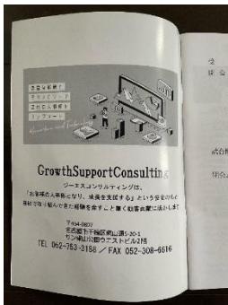
表紙裏・裏表紙裏