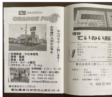
パンフレット協賛