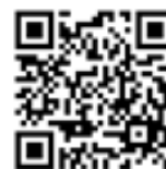
来場申し込みフォーム QR