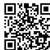
公式 Instagram QR